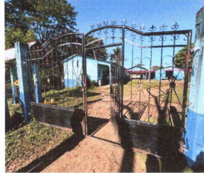
Foto 2: SE OBSERVA DETERIORO DE LA PINTURA DEL PORTONO PRINCIPAL Y LA LAMINA DE ABAJO QUE SE ENCUENTRA OXIDADO