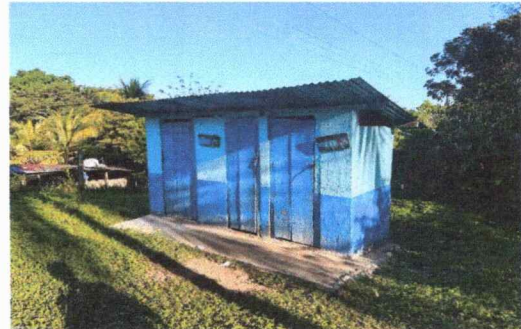
Foto 4: SE OBSERVAN LAS PUERTAS YA DETERIORADAS POR EL TIEMPO QUE LLEVAN DE USO