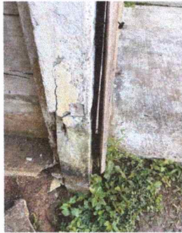
Foto1: SE OBSERVA EL DETERIORO DE LA COLUMNA DEL AULA DONDE RECIBEN CLASES LOS NIÑOS ACTJUALMENTE