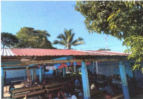
SE OBSERVA LA LAMINA EN MAL ESTADO DETERIORADA